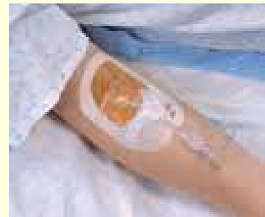
Valve PICC Cœur